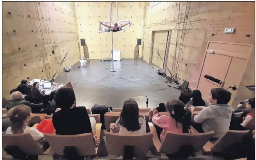
Les circassiens de la troupe bastiaise Mines de rien sont, cette semaine, en résidence au centre Voce de Pigna. Ils donneront une représentation gratuite, samedi à 18 h dans l'auditorium.

Les Mines de rien ont accepté de consacrer une matinée de leur temps pour initier les jeunes enfants aux arts du cirque. Un "baby-cirque" qui a tout de suite