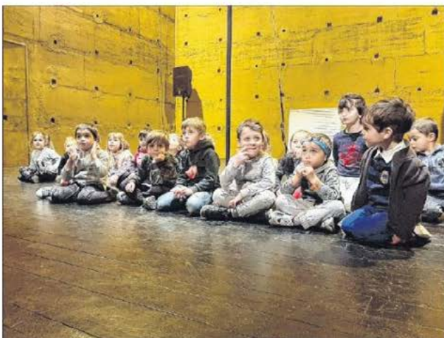
Les 3 - 5 ans du centre aéré intercommunal de Lisula étaient ravis de découvrir les arts du cirque, hier matin à Pigna.